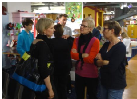
Gespräch mit Besuchern die den Schauspieler bereits von Elspe her kannten