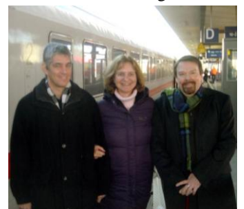
Adieu zum Abschied