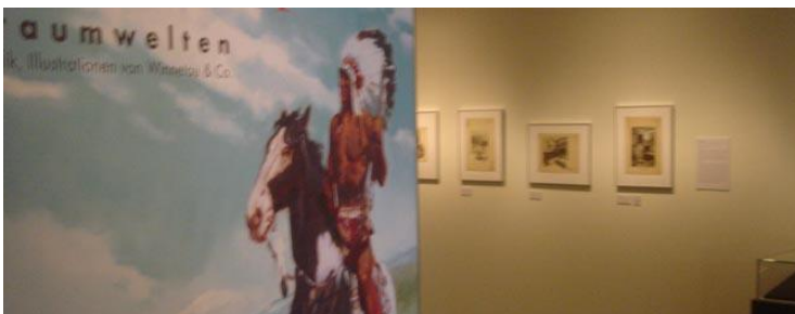
150 Bilder und viele Sammelobjekte gab es zu bewundern