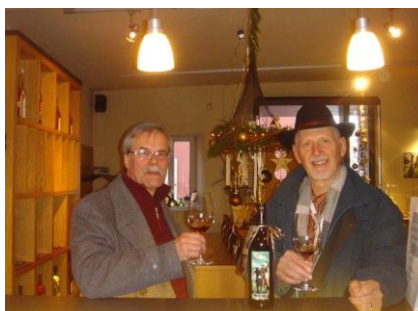
Prost Charley mit Blauburgunder