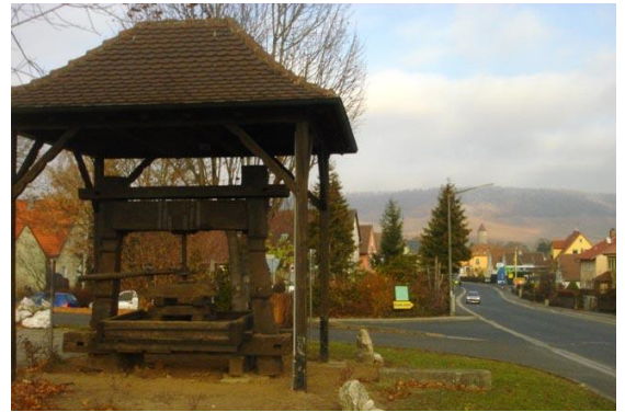
Wein, Gips und Holz, Iphofens Stolz

Der Zug brachte uns via Frankfurt nach Würzburg, dort nahmen wir den Regionalzug in das hübsche fränkische Weinstädtchen .