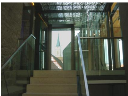
Adieu schöne Sammlung