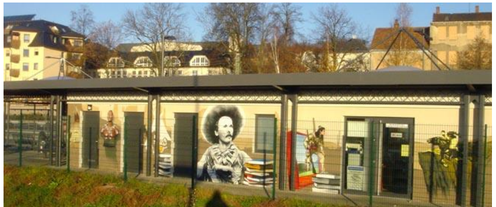
Karl May ein drittes Mal hinter Gittern, wir fahren nach Nürnberg