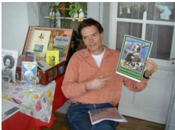
28. 4. 07 Bönigen