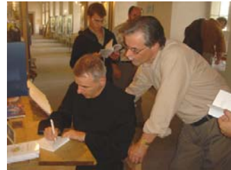
16. 6. 07 Einsiedeln