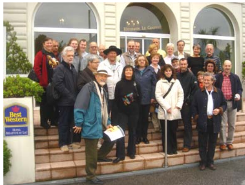
28. - 30. 9. 07 Lugano