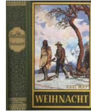
2. 12. 07 Weihnacht