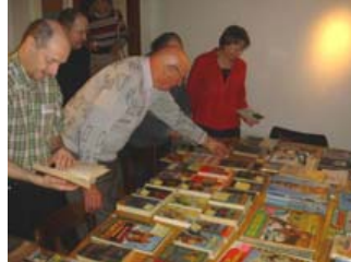
4. 2. 07 Basel Birsfelden