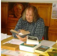
29.7. 07 Weggis-Rigi