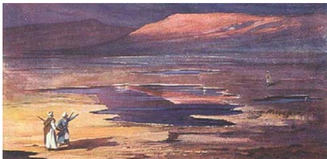
Illustration aus „Durch die Wüste“ Verlag Fehsenfeld, 1908