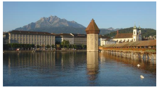
Luzern mit Pilatus 2120 M, Kapellbrücke