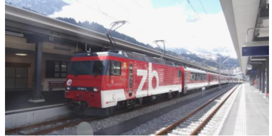
Die Reise von Luzern nach Engelberg geht mit der Zahnradbahn, denn Engelberg liegt auf 1110 M. ü M.