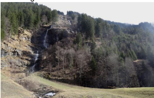
Wasserfall und Spielstätte