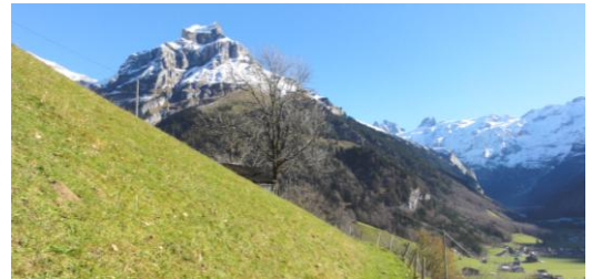
Hinten im Tal die Spielstätte von Winnetou