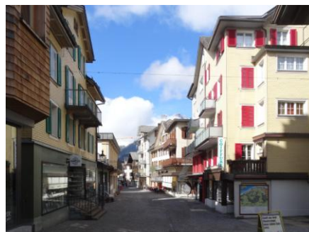
In Engelberg autofrei flanieren ...