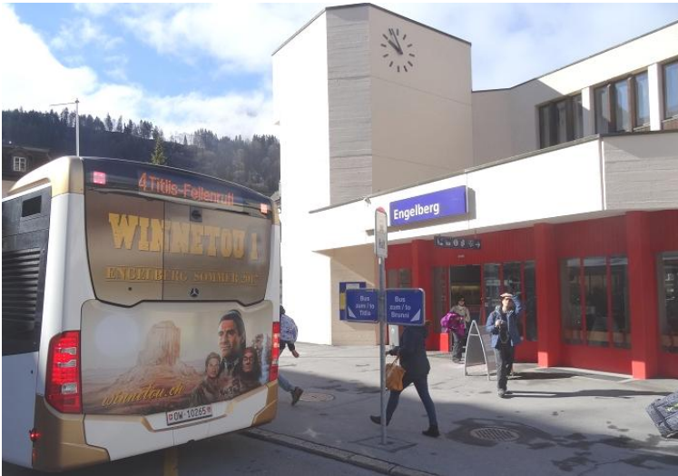
Werbung für Winnetou