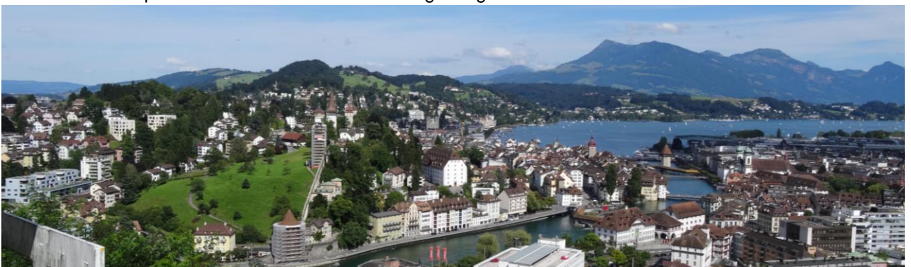
Luzern, weltberühmte Kleinstadt im Herzen der Schweiz. See und Berge laden zum Entdecken ein