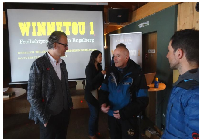
Auch die Titlisbahn ist präsent