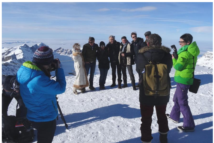
Probe für die Blutsbrüderschaft? Für viele ist dieser gesponserte Ausflug krönender Abschluss