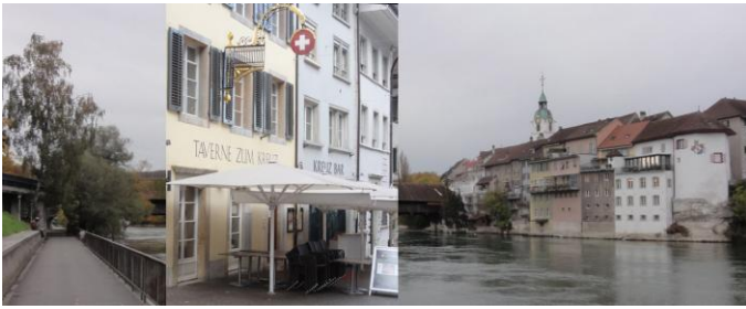
Taverne Restaurant Kreuz in Olten

Die Zusammenkunft einiger Besucher von verschiedenen KM-Veranstaltungen wurde mittlerweile zu einer Tradition. Olten eignet sich gut dazu. Dieses Jahr erinnerten wir uns an Bad Segeberg, Lugano, Radebeul, dem 3. Treffen in Wien, KM-Filmplakate in Utzigen, Freiburg i.Br. und Referat in Vitznau