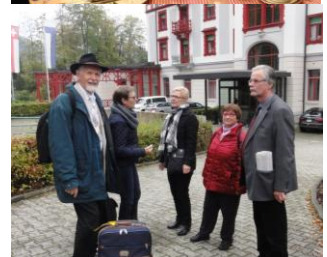
2014, die Aktivitäten