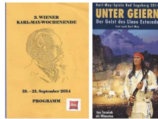
Wien und Bad Segeberg